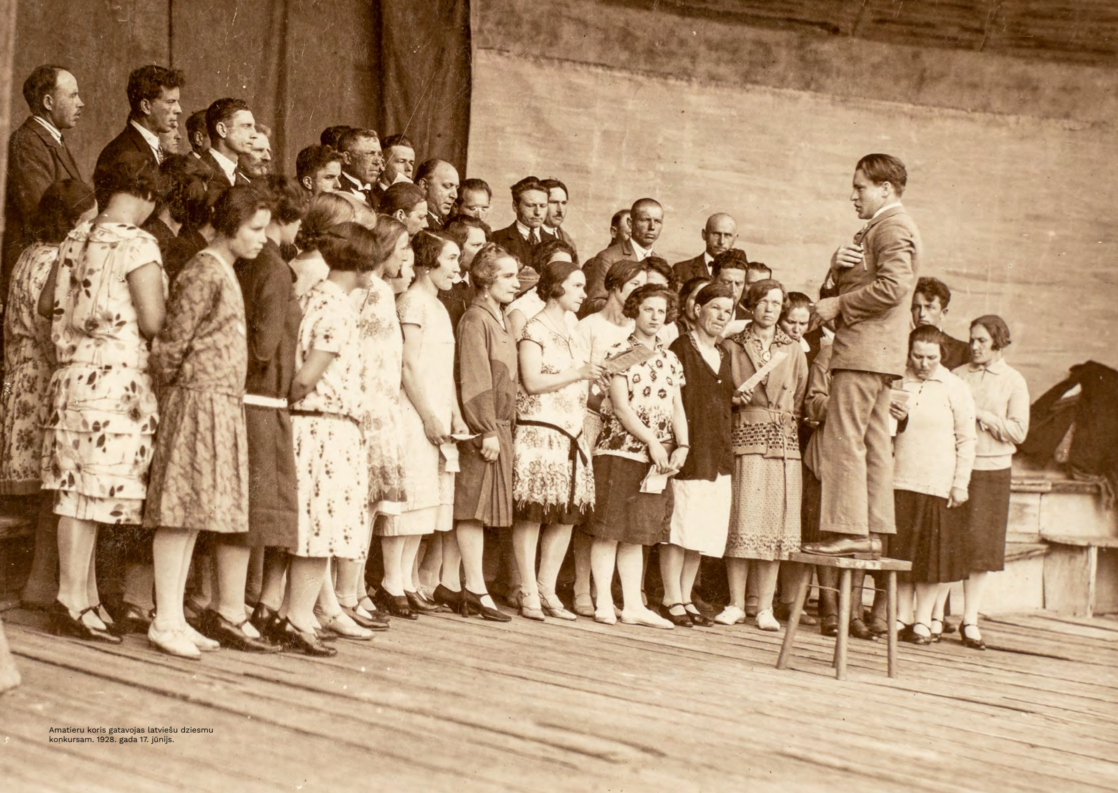
Amatieru koris gatavojas latviešu dziesmu konkursam. 1928. gada 17. jūnijs.